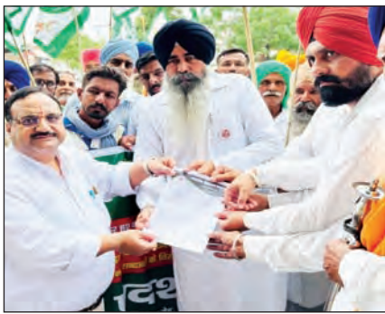
मोहाली एयरपोर्ट पर हुए घटनाक्रम में महिला कर्मचारी के खिलाफ की गई एकतरफा कार्रवाई के विरोध में प्रदर्शन किया।